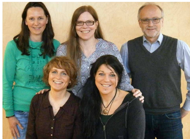
Team der Praxis für Ergotherapie